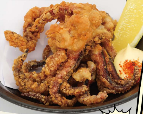
GESOKARA Frittierte Tintenfisch-Tentakel