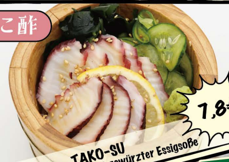
TAKO-SU Gurke und Oktopus mit gewürzter Essigsauce