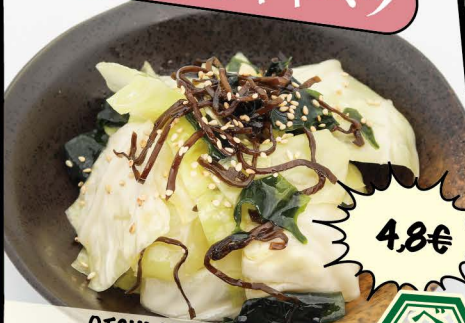
OTSUMAMI-KYABETSU Japanischer Spitzkohlsalat