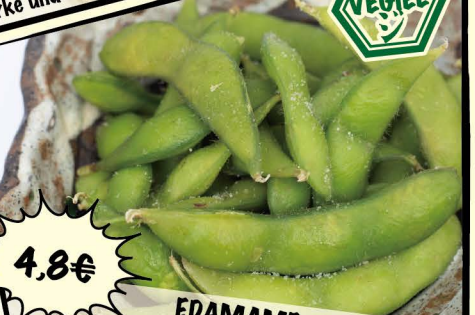
EDAMAME gekochte Sojabohnen