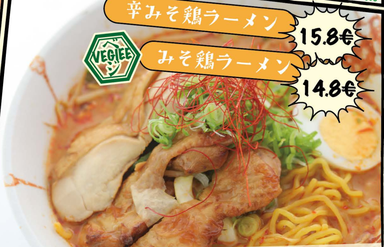
KARAMISO CHICKEN RAMEN 15.8€

Scharfe Miso-Ramen mit Hähnchenfleisch, halbgerechtes Ei und versch. Gemüse