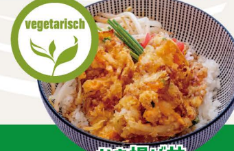
かき揚げ丼 M-5 KAKIAGE DON Gemüse Tempura auf Reis 5,80€