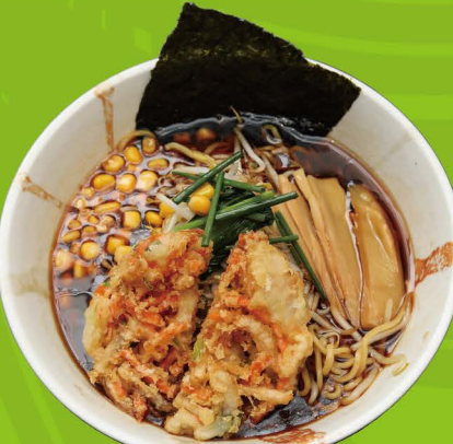
R-10 ベジかき揚げ醤油ラーメン VEGGIE KAKIAGE SHOYU RAMEN Vegetarisch Shoyu Ramen mit Veggie Tempura und Gemüse 13,80€