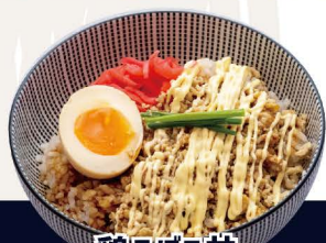
鶏そぼろ丼 M-1 TORI SOBORO DON Hähnchenhackfleisch mit Teriyaki-Soße auf Reis 6,80€