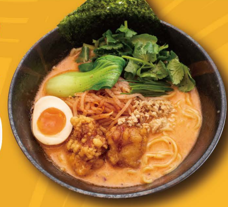
P-2 麻辣鶏白湯ラーメン MALA PAITAN RAMEN (Scharf) mit frittiertem Hähnchen, Hähnchenhackfleisch und Koriander Topping, mit Chili-Öl 15,80€