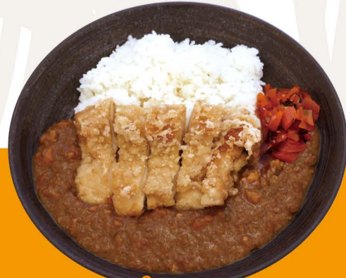
クリスピーチキンカレー C-2 CRISPY CHICKEN CURRY Curry Reis mit Crispy Chicken Topping 13,80€