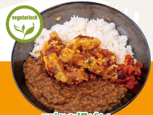
ベジかき揚げカレー C-5 VEGGIE KAKIAGE CURRY Vegetarische Curry Reis mit Gemüse Tempura Topping 12,80€