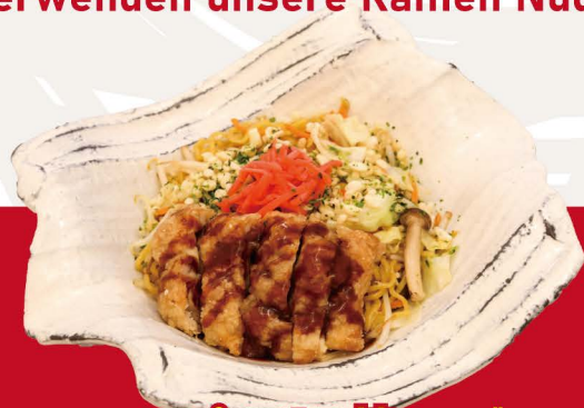
クリスピーチキン焼きそば V-2 CRISPY CHICKEN YAKISOBA Gebratene Nudeln mit Crispy Chicken Topping 14,80€