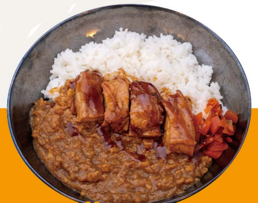
照り焼きチキンカレー C-1 TERIYAKI CURRY Curry Reis mit Teriyaki Hähnchen Topping 12,80€

Empfohlene Toppings für Curry Reis Scharf (Chilli Öl) +1,00€ Eingelegtes Ei +1,50€