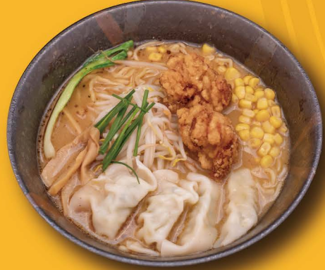
R-4 餃子鶏味噌ラーメン MISO GYOZA RAMEN Miso Ramen mit Chicken Gyoza 14,80€