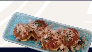
たこ焼き D-4 TAKOYAKI Frittierte Teigugeln mit Oktopus 6,50€