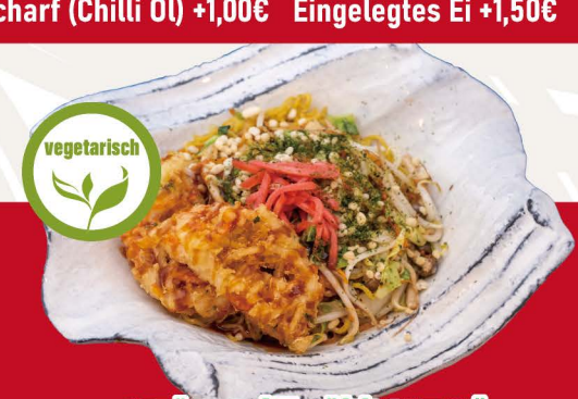
ベジかき揚げ焼きそば V-5 VEGGIE KAKIAGE YAKISOBA Vegetarische gebratene Nudeln mit Gemüse Tempura Topping 13,80€