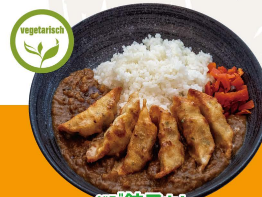
ベジ餃子カレー C-4 VEGGIE GYOZA CURRY Vegetarische Curry Reis mit Veggie Gyoza Topping 12,80€