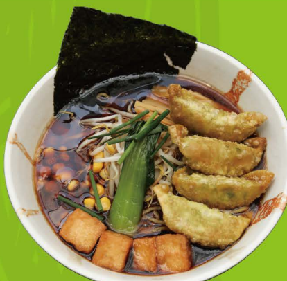
R-12 ヴィーガン醤油餃子ラーメン VEGAN SHOYU GYOZA RAMEN Vegan Shoyu Ramen mit Vegan Gyoza 14,80€