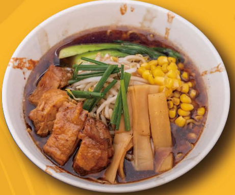
R-1 鶏醤油ラーメン SHOYU RAMEN mit Chicken Teriyaki 11,80€