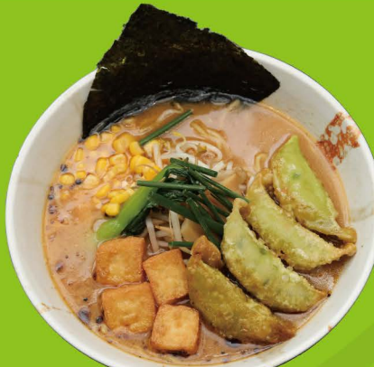
R-13 ヴィーガン味噌餃子ラーメン VEGAN MISO GYOZA RAMEN Vegan Miso Ramen mit Vegan Gyoza 15,80€