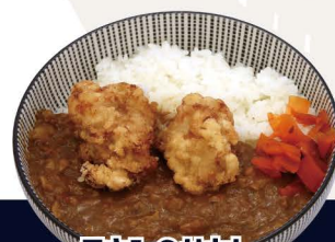
チキンのセカレー M-4 CHICKEN CURRY REIS Curry Reis mit frittiertem Hähnchenstücken 6,80€