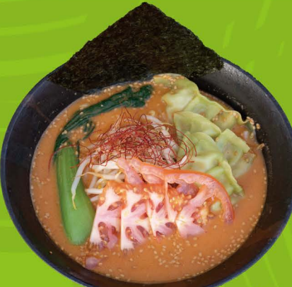
R-11 ヴィーガン担々麺 VEGAN TAN TAN MEN Scharfe Vegan Miso Ramen mit Sesam und Vegan Gyoza 13,80€