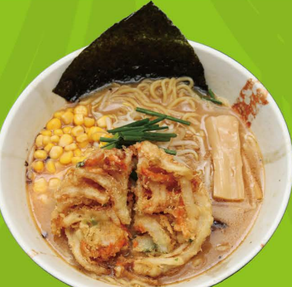
R-9 ベジかき揚げ味噌ラーメン VEGGIE KAKIAGE MISO RAMEN Vegetarisch Miso Ramen mit Veggie Tempura und Gemüse 14,80€