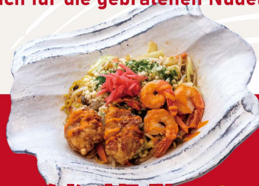
海老と唐揚げ焼きそば V-3 EBI KARA YAKISOBA Gebratene Nudeln mit frittiertem Hähnchenstück und Garnelen Topping 15,80€