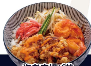
海老唐揚げ丼 M-3 EBI KARA DON Frittiertes Hähnchenstück und Garnelen auf Reis 7,80€