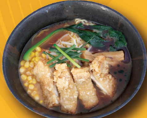
R-14 クリスピーチキン鶏醤油ラーメン CRISPY SHOYU RAMEN Shoyu Ramen mit Crispy Chicken und Gemüse 13,80€