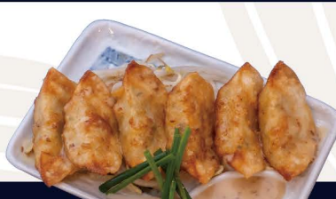
揚げ鶏餃子 D-5 FRY GYOZA Frittierte Teigtaschen mit Hähnchen und Gemüse 5,80€