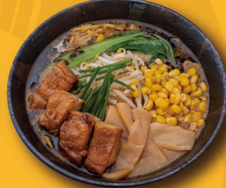
R-2 鶏味噌ラーメン MISO RAMEN mit Chicken Teriyaki 12,80€