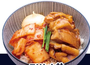
テリヤキ丼 M-2 TERIYAKI DON Teriyaki Hähnchen auf Reis 6,80€