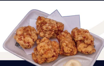
鶏の唐揚げ D-3 KARAAGE Frittierte Hähnchenstücke 6,50€