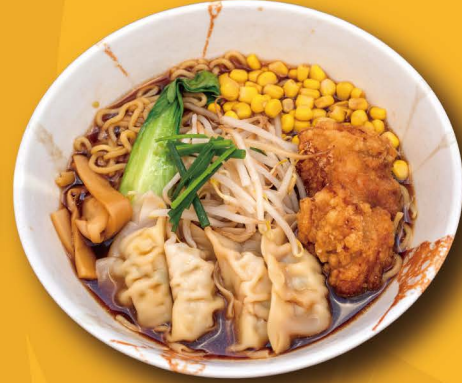
R-3 餃子鶏醤油ラーメン SHOYU GYOZA RAMEN Shoyu Ramen mit Chicken Gyoza 13,80€