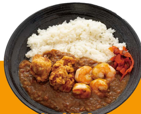
海老と唐揚げカレー C-3 EBI KARA CURRY Curry Reis mit frittiertem Hähnchenstück und Garnelen Topping 14,80€