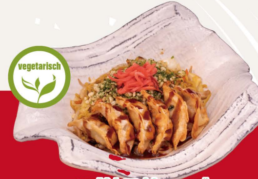
ベジ餃子焼きそば V-4 VEGGIE GYOZA YAKISOBA Vegetarische gebratene Nudeln mit Veggie Gyoza Topping 13,80€