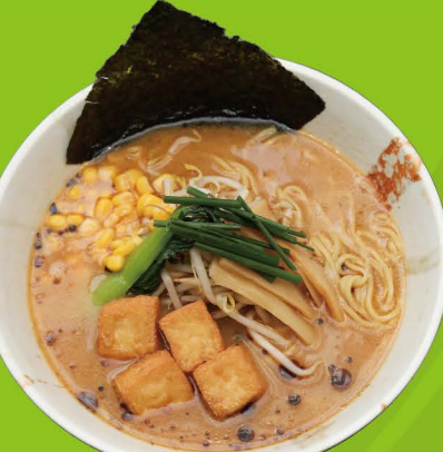
R-8 ヴィーガン味噌ラーメン VEGAN MISO RAMEN Vegan Miso Ramen 12,80€