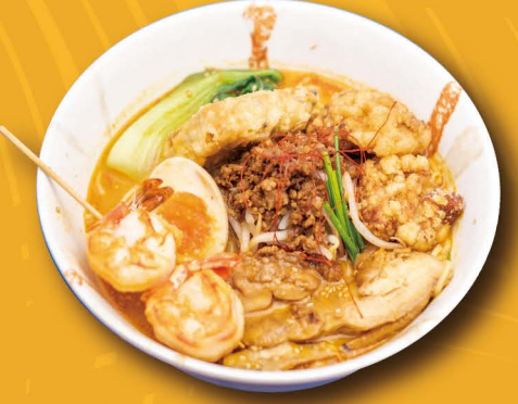
P-3 SPECIAL TAN TAN MEN (Scharf) Scharfe Miso Ramen mit Sesam, Karaage, Shrimps, Teriyaki, Ei, Gemüse Tofu und Hähnchenhackfleisch 17,80€