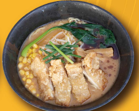
R-5 クリスピーチキン鶏味噌ラーメン CRISPY MISO RAMEN Miso Ramen mit Crispy Chicken und Gemüse 14,80€