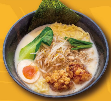
P-1 濃厚鶏白湯ラーメン PAITAN RAMEN mit frittiertem Hähnchen (Karaage)- und Hähnchenhackfleisch Topping 14,80€

Unsere Spezialität mit extra lang eingekochter, milchiger Hühnerbrühe. Die Brühe ist milchig weiß und hat ein mildes und trotzdem intensives Aroma. Getoppt mit verschiedenem Gemüse und einem halben eingelegten Ei.