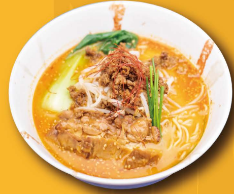
R-6 担々麺 TAN TAN MEN (Scharf) Scharfe Miso Ramen mit Teriyaki Hähnchen und Hähnchenhackfleisch 14,80€

Tantan-Men wird mit der Schärfe von Chilischoten und dem chinesischen Pfeffer, Sesampaste und Miso/Shoyu-Soße zubereitet und somit spielt eine exquisite Harmonie.