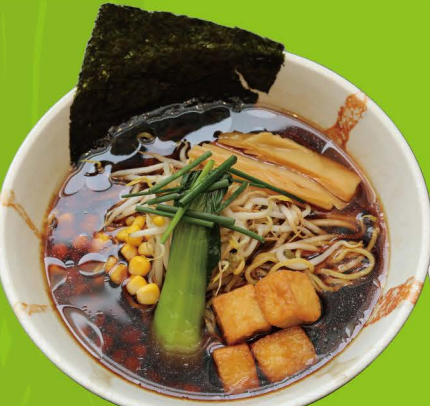
R-7 ヴィーガン醤油ラーメン VEGAN SHOYU RAMEN Vegan Shoyu Ramen 11,80€