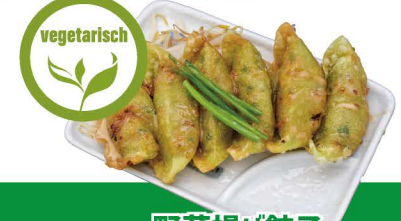
野菜揚げ餃子 D-6 VEGGIE FRY GYOZA Frittierte Teigtaschen mit Gemüse 5,80€